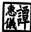
土地註冊處處長譚惠儀

6. 如有查詢，請致電 3105 0000 與街道索引及對照表支援小組或客戶服務經理蔡繡文女士聯絡。