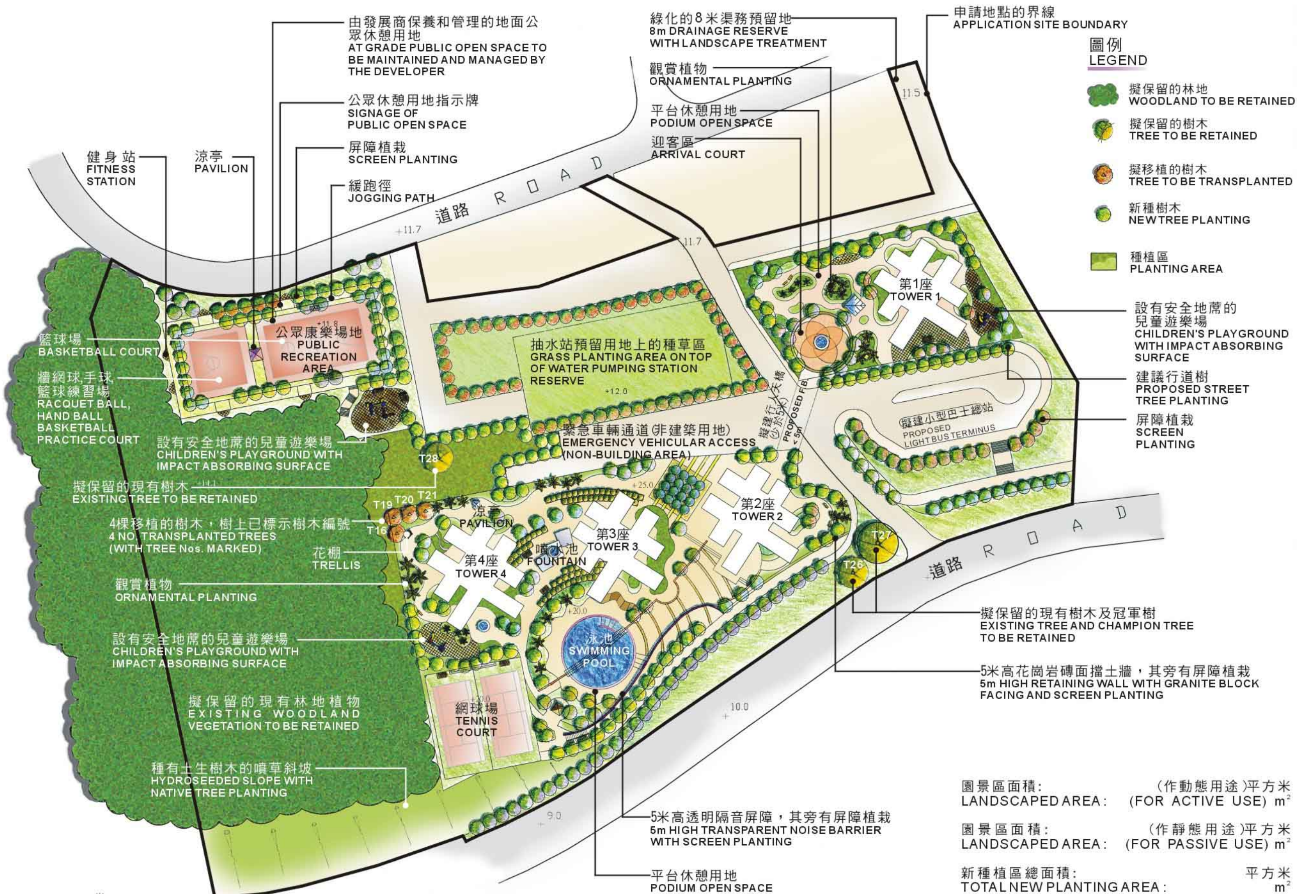
有關於地段第_____號擬議綜合發展的園景建議 LANDSCAPE PROPOSAL FOR PROPOSED COMPREHENSIVE DEVELOPMENT AT LOT No. _____

園景區面積: (作動態用途) 平方米 LANDSCAPED AREA: (FOR ACTIVE USE) m 2 園景區面積: (作靜態用途) 平方米 LANDSCAPED AREA: (FOR PASSIVE USE) m 2 新種植區總面積: 平方米 TOTAL NEW PLANTING AREA: m 2 有蓋新種植區面積: 平方米 COVERED NEW PLANTING AREA: m 2